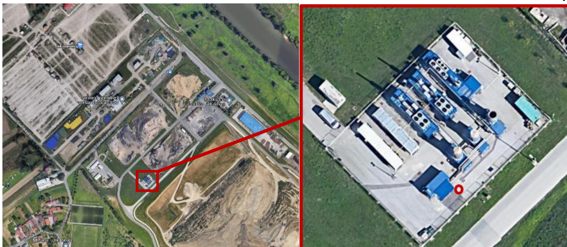
Slika 2. Mjerno mjesto na Odlagalištu otpada Jakuševci